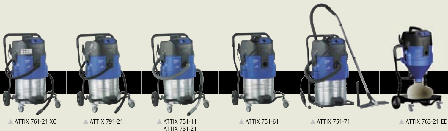
▲ ATTIX 761-21 XC