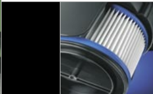
◀ PE-vlies* filter Uitwasbaar en duurzaam filter met een hoge filtratie voor een schone lucht.

Enorm zuigvermogen, fluisterstil en voorzien van innovatieve “snuffjes” – neem met minder geen genoeg